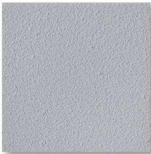
Typical 8/H Spectral Reflectance Factor

The only choice when durability matters most